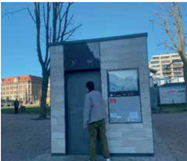
Imagen 2. Servicios sanitarios de uso público y gratuito en Berlín.

Generalmente, las ciudades han ignorado las necesidades básicas de los ciudadanos, como generar espacios de descanso, protección del sol y la lluvia,