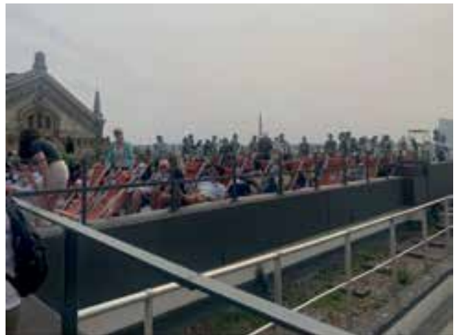
Imagen 9. Promoción de dinámicas en el espacio público para satisfacer la necesidad de reconocimiento, asociados con logro, gloria y orgullo (Gradería efímera para espectadores del evento Roland Garros en París).

La historia de Alemania es un determinante en el reconocimiento y estima que el pueblo tiene de sí mismo. Las señales en los espacios públicos son un recordatorio de lo que quieren expiar, de las marcas de errores que sus antepasados cometieron y que les queda como aprendizaje para no repetirlo. Berlín señala, con los fragmentos de su legendario muro (que se encuentra en diversas zonas de la ciudad) y con placas metálicas en el piso, la división de que fue víctima (Imagen 8) y