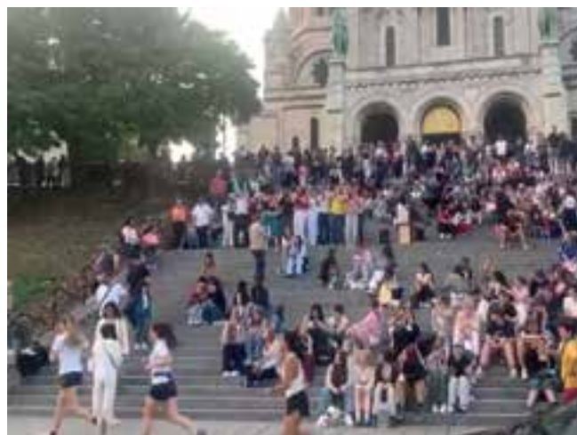
Imagen 11. El espacio público como escenario para la realización de prácticas deportivas.

Se concluye que tanto el tejido urbano como el tejido social resultan determinantes en la calidad de vida y satisfacción de todas las necesidades humanas. Las diferentes necesidades, que van desde las fisiológicas hasta las de autorrealización, no mantienen entre sí una jerarquía ni secuencialidad lineal, sino que se relacionan como una imbricada red, de forma que se afectan y nutren, definiendo condiciones de calidad de vida que no son excluyentes, sino sistémicas. Resulta evidente que el nivel de satisfacción de los habitantes de una ciudad es subjetivo, que siempre habrá lugar a variabilidades y posibles confrontaciones; de manera que las prioridades y preferencias podrán presentar cierta diversidad, pero una plataforma urbana sí es definitoria en todos los sentidos, para todo tipo de necesidades distinguidas por Maslow.