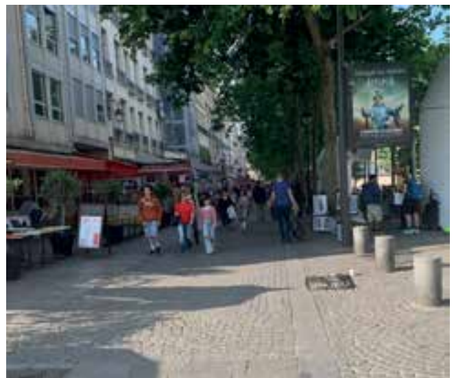
Imagen 5. Desarrollo de espacios peatonales o de usos compartidos que brindan seguridad al ciudadano.