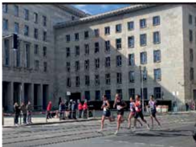
Imagen 10. El espacio público, escenario de circuitos atléticos que promueven el auto reconocimiento a través de logros deportivos.

de propios y extraños. Las ciudades europeas promueven de manera reiterada la celebración de eventos que satisfagan esta necesidad, tales como torneos deportivos