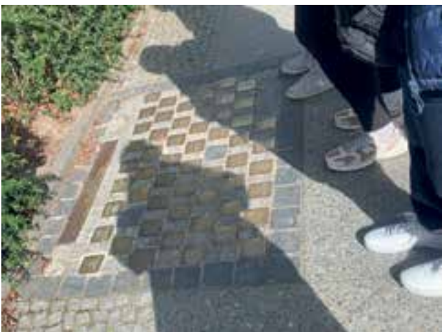
Imagen 8. Marcas históricas en los espacios urbanos que guardan la memoria de acontecimientos pasados (personas judías detenidas en Berlín).

Es importante destacar que, para que este enfoque se cumpla y no se propicien dinámicas de exclusión social, gentrificación y desplazamiento, es necesario el cuidado de políticas de vivienda y uso del suelo que otorguen protección a los habitantes, así como fortalecer modelos de gobernanza que prioricen el derecho a la ciudad.