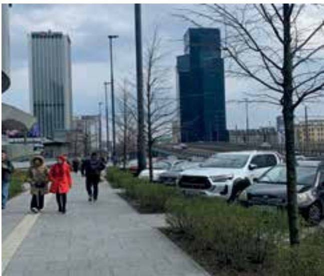
Imagen 4. Espacios peatonales (amplios, con guía podotáctil, sin obstáculos visuales) combinados con ciclovías y áreas verdes en Berlín.

Por su lado, París se enfoca en estrechar su sentido de pertenencia a través de su imagen urbana. Así quedó en evidencia en las pasadas Olimpiadas París 2024, donde las actividades deportivas se celebraron en los entornos públicos (adaptaciones en el río Sena, en Trocadero, en la Torre Eiffel, en la Plaza de la Concordia, entre otros) en una apropiación de tal magnitud del espacio público sin precedentes en ningún evento olímpico. Así, los espacios legendarios de París corresponden a espacios públicos, como los jardines de las Tullerías, la avenida Campos Elíseos, la orilla del río Sena (Imagen 7) y las grandes explanadas que anteceden lugares como el Museo del Louvre, la Catedral de Notre Dame, entre otros, que incluso