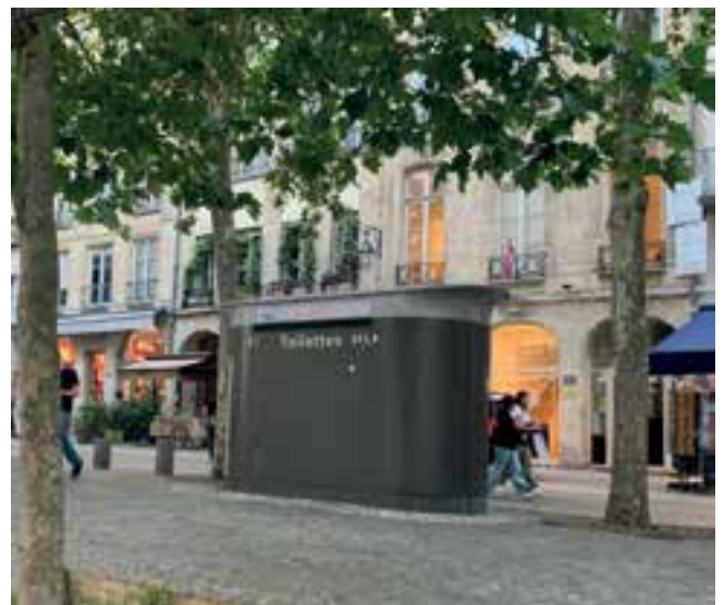
Imagen 3. Servicios sanitarios de uso público y gratuito en París.

En contrasentido, es importante reconocer el esfuerzo, pero también señalar que su existencia es aún acotada a las regiones con mayor equipamiento o mayor flujo turístico, por lo que se espera se democratice en todas las regiones.