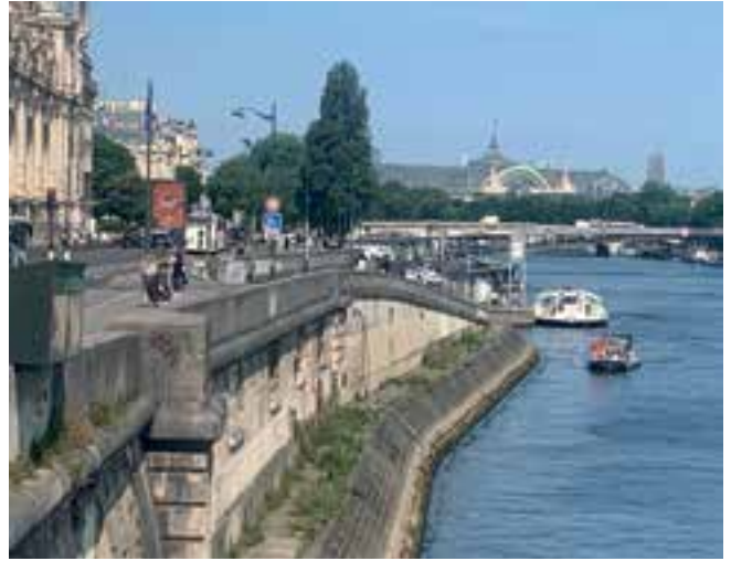
Imagen 7. París ha apostado por impulsar el tejido social a través del fortalecimiento del espacio público en el que grupos de diversas clases (sociales, etarias, entre otros) encuentren un espacio propio.